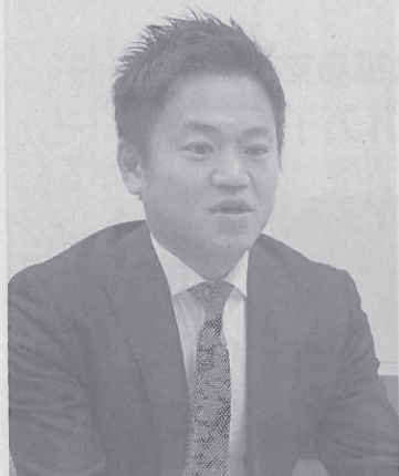
「引っ越しは夢を持てる仕事」と文字社長

現状をプラスと受け止め、更に、CS（顧客満足度）とES（従業員満足度）の向上にも力を入れている。同社では「センサーコントロール方式」の採用やIT（情報技術）の活用による生産性の最大化に傾注。さらに、CS（顧客満足度）とES（従業員満足度）の向上にも力を入れている。同社では「センサーコントロール方式」の採用やIT（情報技術）の活用による生産性の最大化に傾注。